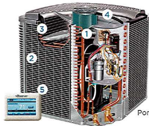
Pompe à chaleur

Les climatiseurs et pompes à chaleur à système bibloc Comfortmaker sont conçus pour un niveau optimal de confort et de durabilité. Des combinaisons correctement appariées d'un climatiseur ou d'une pompe à chaleur à l'extérieur et d'une unité intérieure séparée peuvent être personnalisées pour assurer la climatisation, le chauffage au gaz et/ou le chauffage électrique. En associant l'unité intérieure adéquate à une unité extérieure correspondante, différentes méthodes de climatisation et de chauffage peuvent être combinées pour offrir la solution optimale en confort, efficacité et économie.